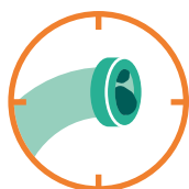
Filtres ou tuyaux bouchés

rapporté au SAV souffre juste d'un défaut d'entretien et ne nécessite aucune pièce de rechange (c'est même 60 % des cas pour le gros électroménager !).